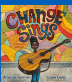
Change Sings por Amanda Gorman

LITERATURA RELEVANTE para que los estudiantes lean