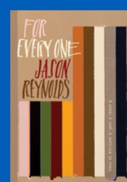
For Everyone por Jason Reynolds